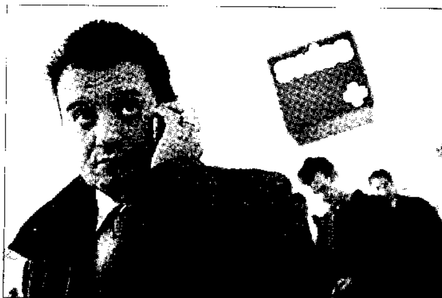
En España hay 49.038.712 líneas de móviles.

a postpago. El resto de ellas, 91.708 son de prepago. El acumulado anual se cifra en 2.273.957 líneas. Durante el mes de septiembre Vodafone ha sido el operador que ha ganado mayor contratación de líneas. La compañía británica ha obtenido el 49,8% de las nuevas líneas. El segundo puesto ha sido para Movistar